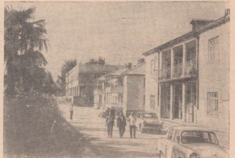
Грузинская ССР. На Всесоюзный смотр-конкурс 1969 года на лучшую застройку и благоустройство колхозных и совхозных поселков представлены центральные усадьбы Лайтурского и Ингирского чайных совхозов и колхозные села Земо-Баргеби Гальского района и Нагомари Махарадзевского района.

Корнеплоды на полях ряда хозяйств все еще ждут рабочих рук. Служащие контор, пенсионеры, школьники большую помощь оказывают в колхозе «Россия», Шеломковском зерносовхозе, колхозах «Искра», «Заря коммунизма». Только организацией массовых выходов рабочих, служащих и колхозников можно в короткий срок закончить уборку клубней и корнеплодов.